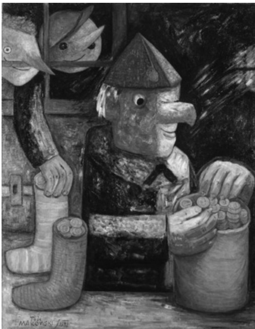
Tadeusz Makowski, Skąpiec (1932) [Muzeum Narodowe w Warszawie]